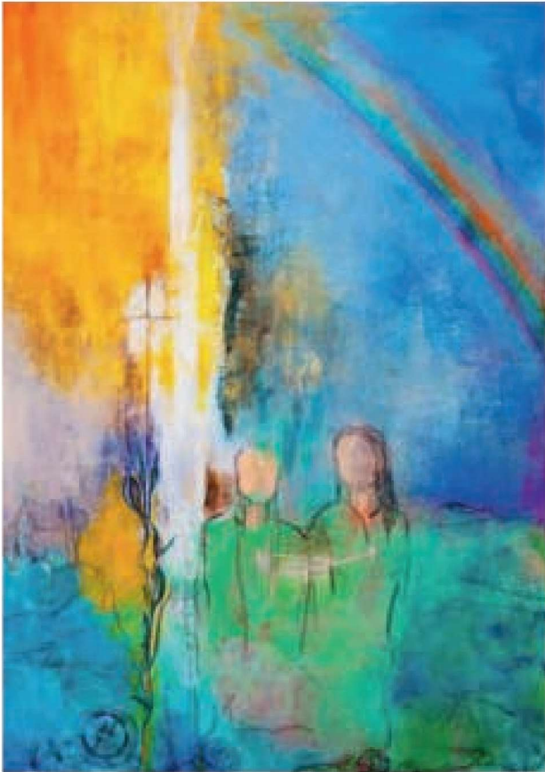
Ausschnitt aus Acryl von U. Wilke-Müller