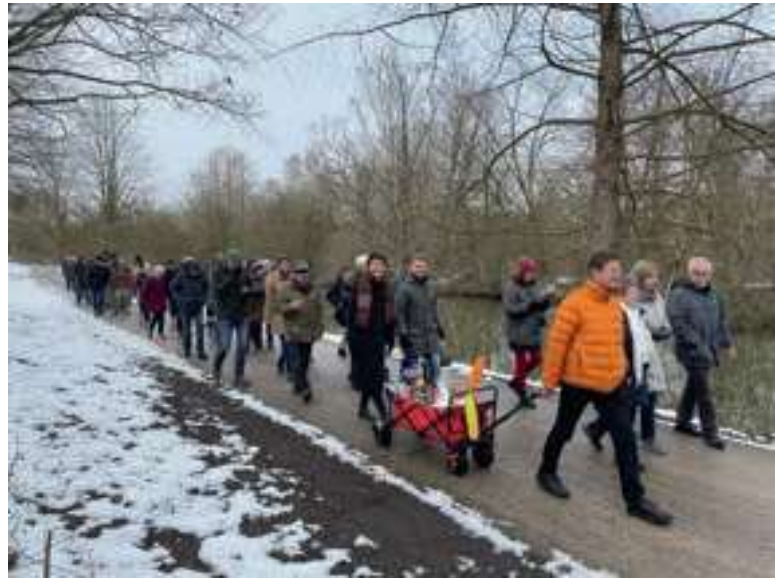
Unterwegs mit dem Bollerwagen

Nach einem erbaulichen Gottesdienst machten sich die lauffreudigen Gemeindeglieder zu einem Spaziergang mit Bollerwagen, Knabberzeug und Getränken auf den Weg, während andere bei Kaffee und Keksen gemütlich im Gemeindesaal sitzen blieben. Trotz etwas rutschiger Wege liefen die Wandernden tapfer durch den Schnee und erfreuten sich umso mehr an wärmenden Getränken aus dem Boller-